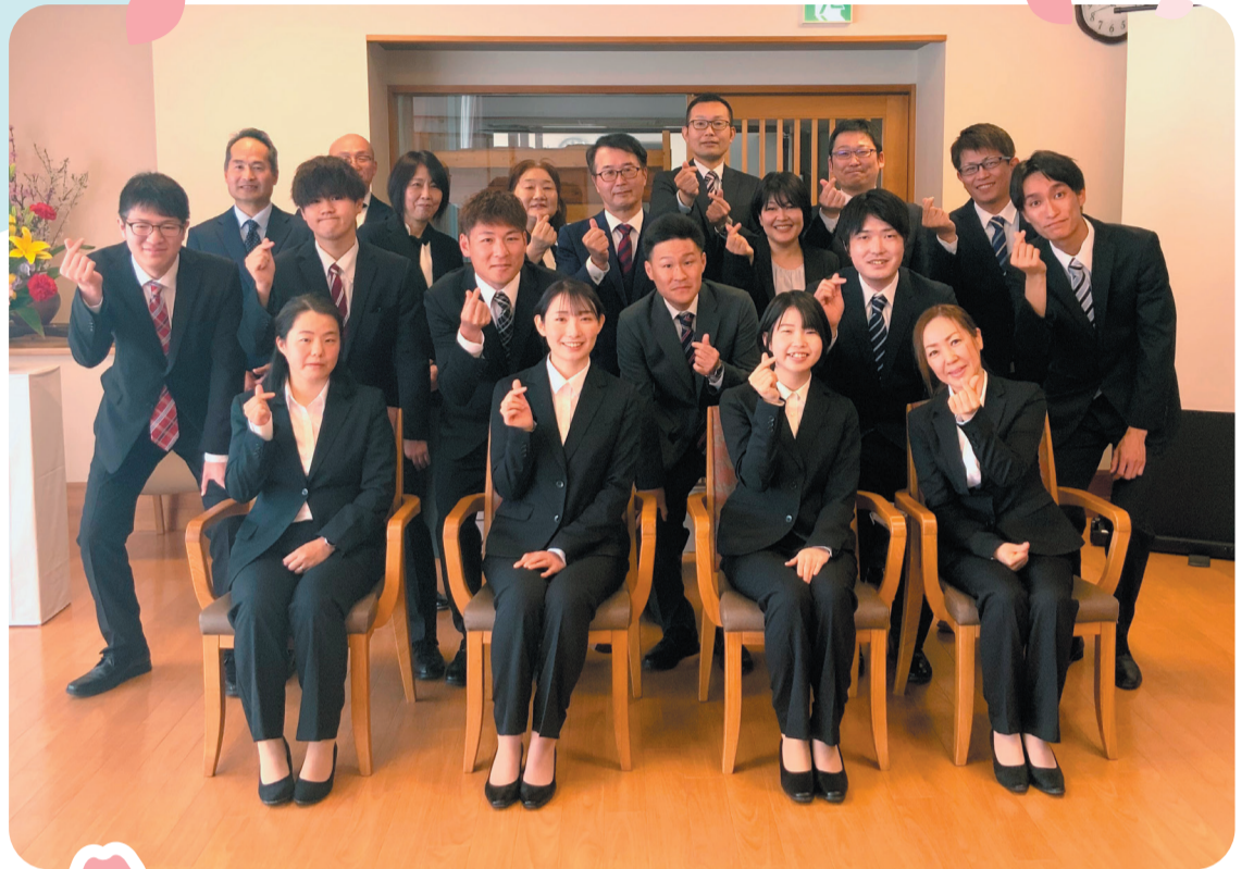
2024年度入社式(前2列が新入職員さん)

制作・発行 法人機関紙編集委員会 FAX 086(943)1716 住所 岡山市東区西大寺中野677-1 E-mail kenseien@circus.ocn.ne.jp 電話 086(943)1701 Web Site https://www.chuo-fukushikai.jp