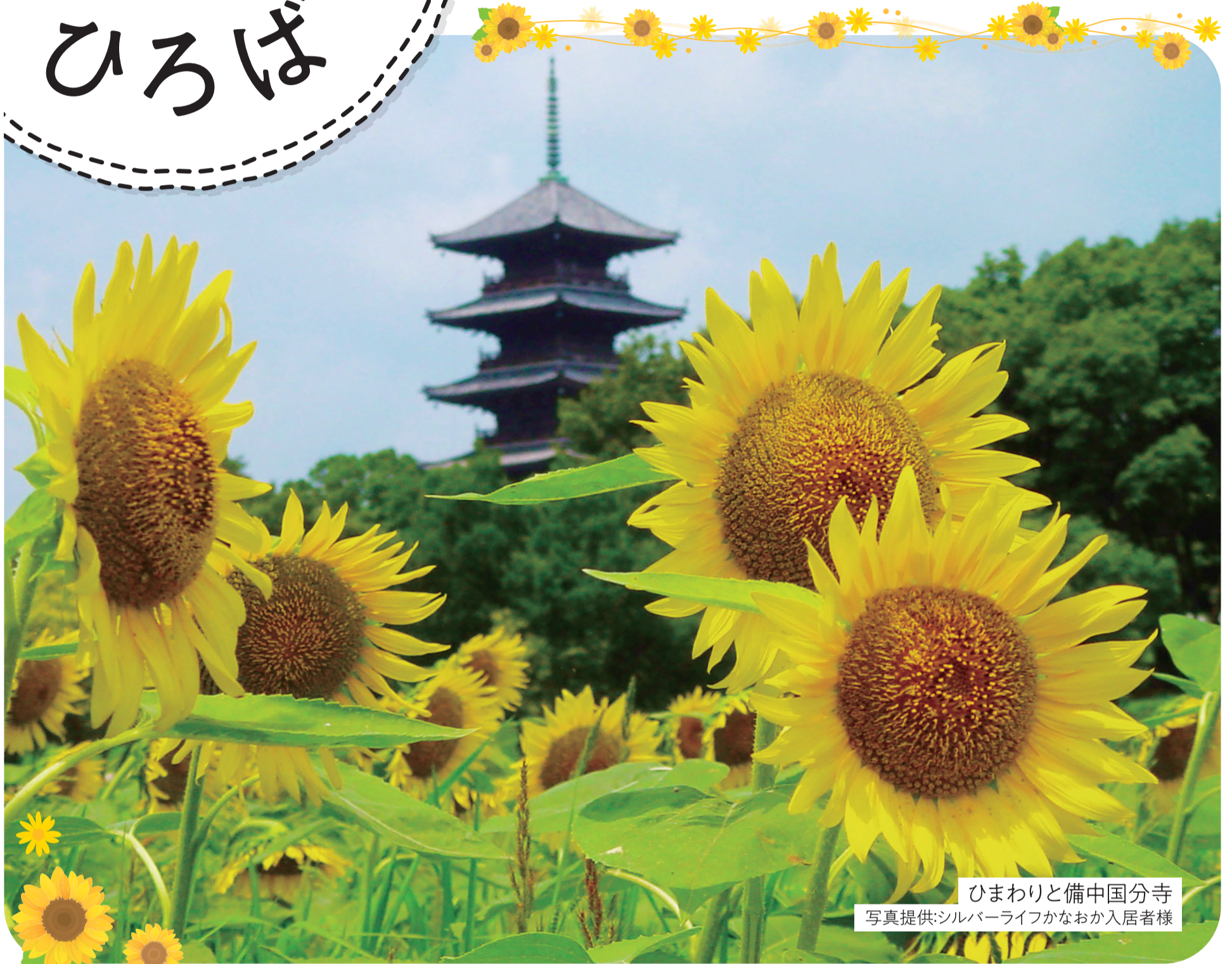
ひまわりと備中国分寺

FAX 086(943)1716 E-mail kenseien@circus.ocn.ne.jp Web Site https://www.chuo-fukushikai.jp